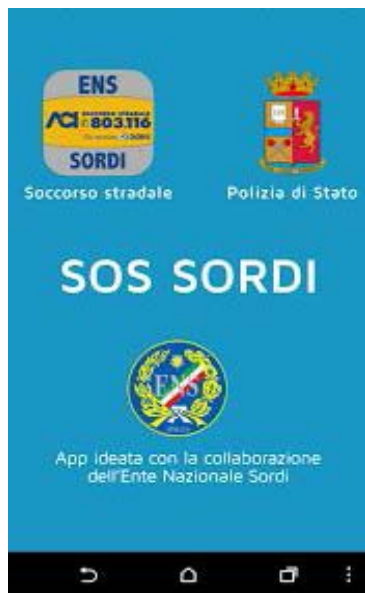
Schermata di avvio applicazione SOS SORDI