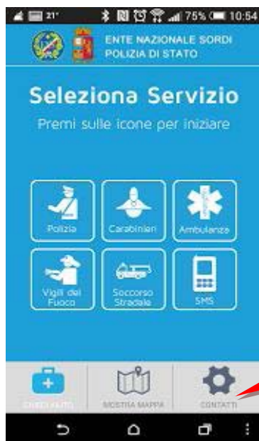
Dopo l'avvio del programma cliccare sulla voce contatti per inserire i numeri di telefono e email